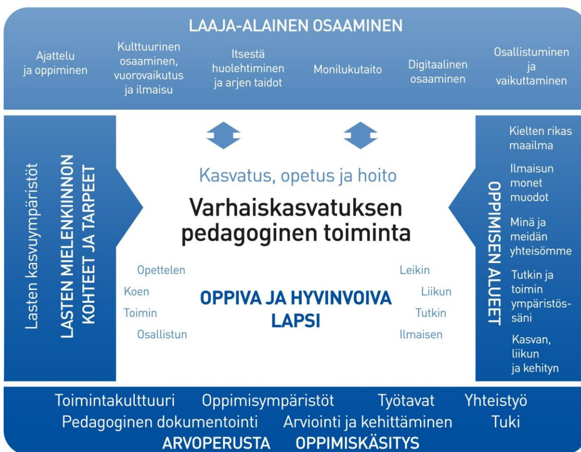
Kuvio 1. Varhaiskasvatuksen pedagogisen toiminnan viitekehys

Varhaiskasvatuksen pedagogista toimintaa ja sen toteuttamista kuvaa kokonaisvaltaisuus. Tavoitteena on edistää lasten oppimista ja hyvinvointia sekä laaja-alaista osaamista (kuvio 1). Pedagoginen toiminta toteutuu lasten ja henkilöstön välisessä vuorovaikutuksessa ja yhteisessä toiminnassa. Lasten omaehtoinen, henkilöstön ja lasten yhdessä ideoima sekä henkilöstön suunnittelema toiminta täydentävät toisiaan. Varhaiskasvatuksen pedagoginen toiminta läpäisee kasvatuksen, opetuksen ja hoidon kokonaisuuden.