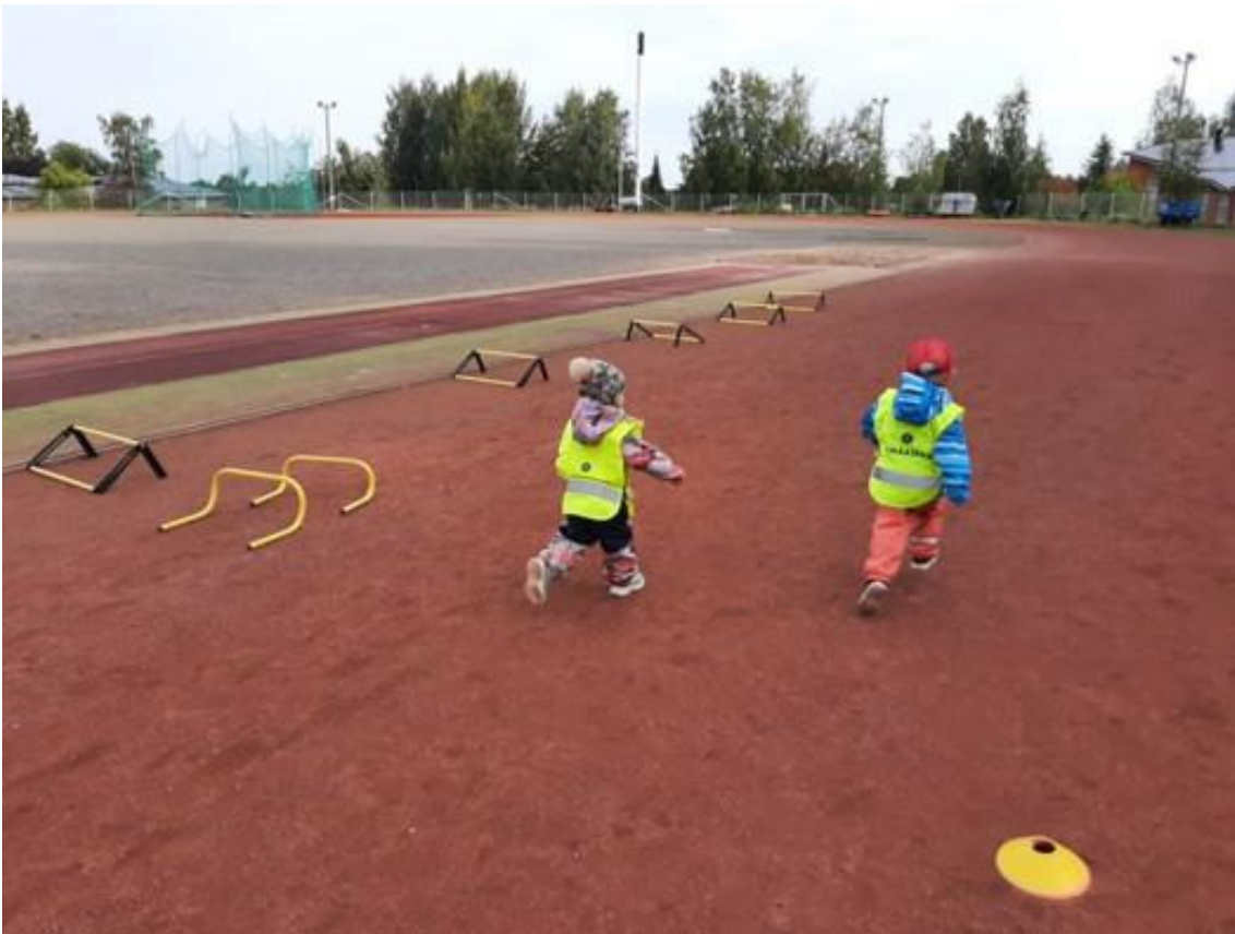
"Paikoillanne, valmiit, HEP!"

Liikkuva varhaiskasvatus -ohjelman tavoitteita tuemme myös erilaisten hankkeiden avulla. Hankkeiden (mm. Parkour, tanssipaja) tavoitteena on saada lapsia ja heidän perheitään innostumaan uusista lajeista sekä viettämään liikunnallista aikaa yhdessä. Perheiden yhteistä liikkumista tuemme haastamalla perheitä liikkumaan yhdessä ja hyödyntämään matkat aktiiviseen liikkumiseen. Liikunnan merkityksestä keskustelemme perheiden kanssa lasten varhaiskasvatussuunnitelmakeskusteluissa.