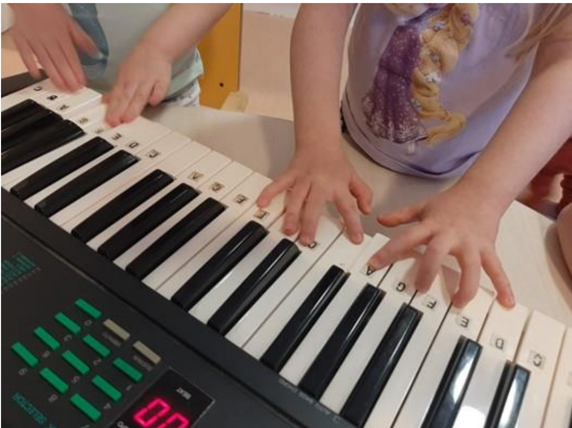
"yksin ja yhdessä kaverin kanssa sooloillen"

Tarjoamme lapsille kokemuksia eri aistien kautta ja hyödynnämme moniaistisia menetelmiä kuten laulu- ja tanssipiirtäminen. Ilmaisussa kiinnitämme huomiota erilaisiin tunteisiin ja aistimuksiin (miltä liima tuntuu sormissa, miltä taikina tuoksuu tai mitkä tunteita värit tai jokin kuva herättävät). Lasten kanssa tutkimme värejä, muotoja ja materiaaleja niin rakennetussa kuin rakentamattomassa ympäristössä.