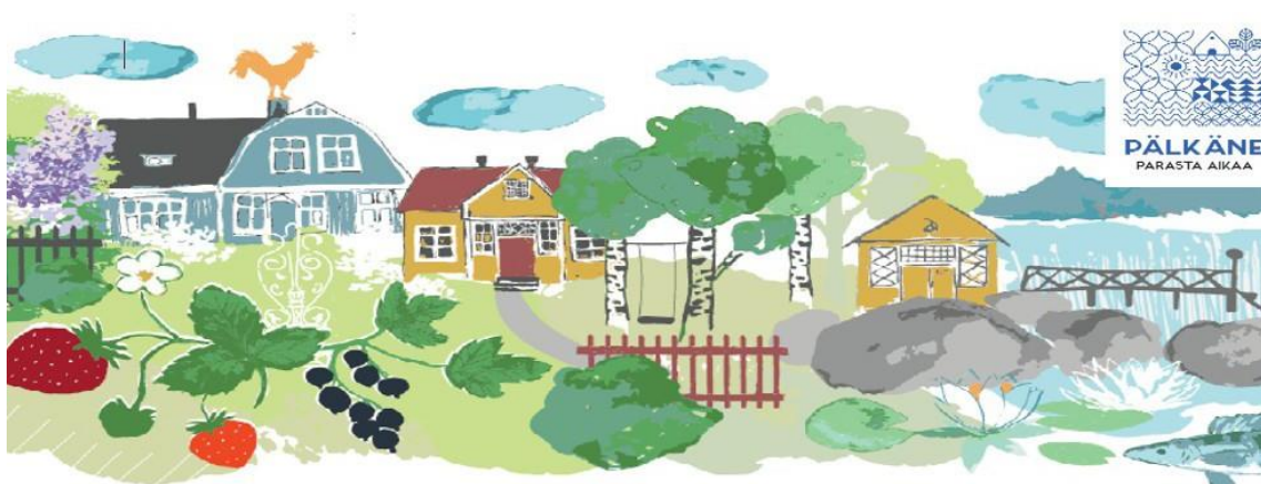
Pälkäne parasta aikaa

Varhaiskasvatussuunnitelmakokonaisuus on kolmitasoinen. Se koostuu valtakunnallisesta varhaiskasvatussuunnitelman perusteista, paikallisista varhaiskasvatussuunnitelmista sekä lasten varhaiskasvatussuunnitelmista.