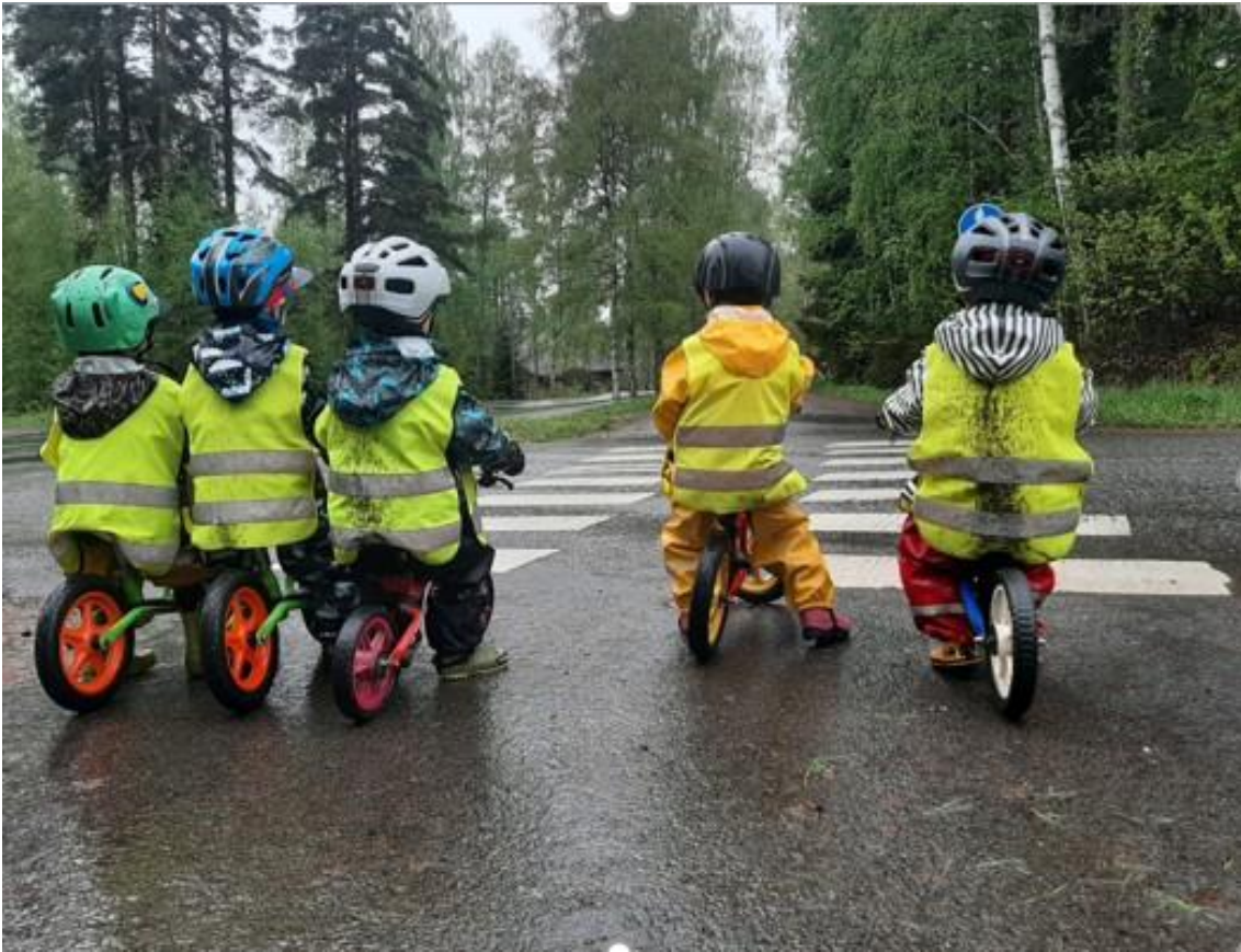
"Muista aina liikenteessä..."

Pälkäneen varhaiskasvatuksen kehotunne- ja turvataitokasvatuksessa suhtaudumme myönteisesti lapsen kysymyksiin kehosta, tunteista ja kehitykseen liittyvistä asioista. Lapsen myönteistä kehoitsetuntoa tuemme hyväksyvän ja turvallisen suhtautumisen kautta siten, että jokainen lapsi voi tuntea oman kehonsa arvokkaaksi. Ohjaamme lapsia kunnioittamaan ja suojelemaan omaa sekä toisten kehoa (yksityisyyden suojeleminen esimerkiksi vessatilanteissa) ja huolehtimaan omasta terveydestään.