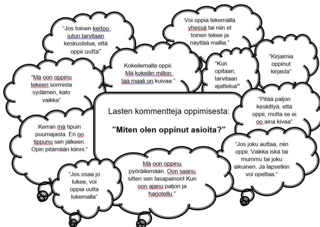
Pätkäneen lasten kommentteja oppimisesta "Miten olen oppinut asioita?"

Rakennamme oppimisympäristöä yhdessä lasten kanssa siten, että siinä näkyy lasten oma kulttuuri ja heidän näkemyksensä maailmasta, kauneudesta ja ympäristöstä. Tarjoamme leikkivälineitä ja erilaisia materiaaleja lasten saataville sekä mahdollistamme niiden monipuolisen käytön. Lapset omaksuvat opeteltavia asioita oman kiinnostuksensa kautta. Tavoitteellinen ja sopivasti haasteita antava toiminta ja ympäristö innostavat oppimaan lisää. Lapsi toimii oppimisympäristössään, jonka olemme muokanneet lapsen taitojen ja omien vahvuuksien mukaan.