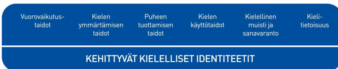
Kuvio 2. Lasten kielen kehityksen keskeiset osa-alueet varhaiskasvatuksessa

Kielen oppimisen kannalta on tärkeää tiedostaa, että saman ikäiset lapset voivat olla eri vaiheissa kielen kehityksen eri osa-alueilla. Kielelliset identiteetit kehittyvät , kun lapsia ohjataan ja tuetaan kielellisten taitojen ja valmiuksien keskeisillä osa-alueilla.