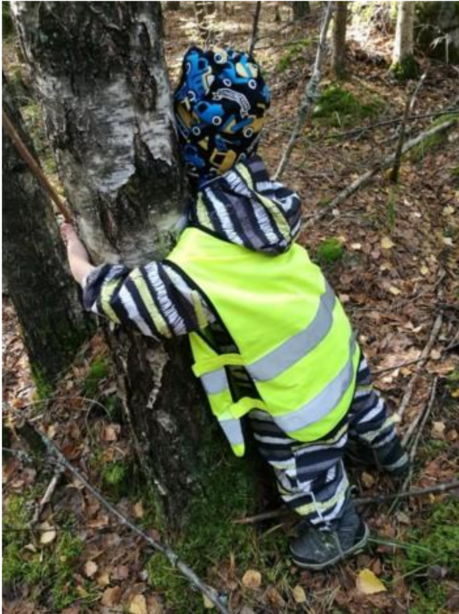
"Metsä hoivaa ja rauhoittaa"

Luonnossa toimimisen tueksi varhaiskasvatukselle laaditaan oma ympäristökasvatussuunnitelma vuoden 2022 aikana. Suunnitelmassa muun muassa esitellään lähiseudun retkikohteita, materiaalivinkkejä sekä vuosikello, jonka avulla voimme toiminnassa huomioida erilaisia teemapäiviä sekä –viikkoja. Suunnitelmassa huomioimme ympäristökasvatuksen ulottuvuudet; oppimisen ympäristöstä ja ympäristössä sekä toimimisen ympäristön puolesta.