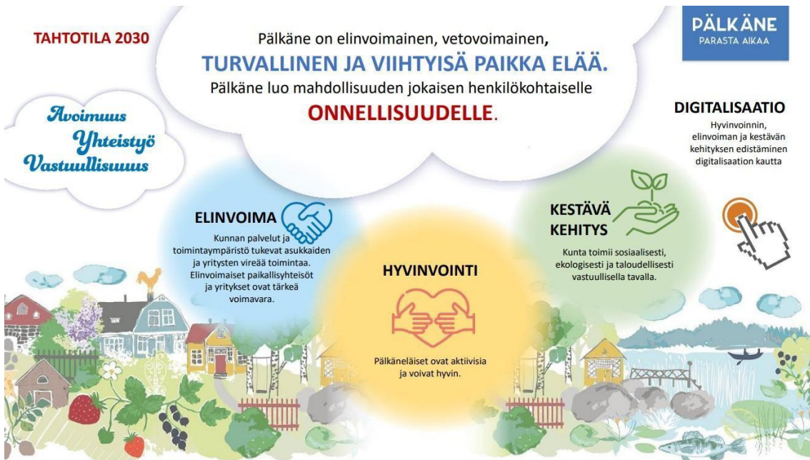
Pälkäneen kuntastrategia 2030

Pälkäneen kunnassa on päivitetty kuntastrategia vuonna 2021, joka on voimassa vuoteen 2030 asti. Pälkäneen kuntastrategian 2030 kokonaisuudessaan löydät täältä .