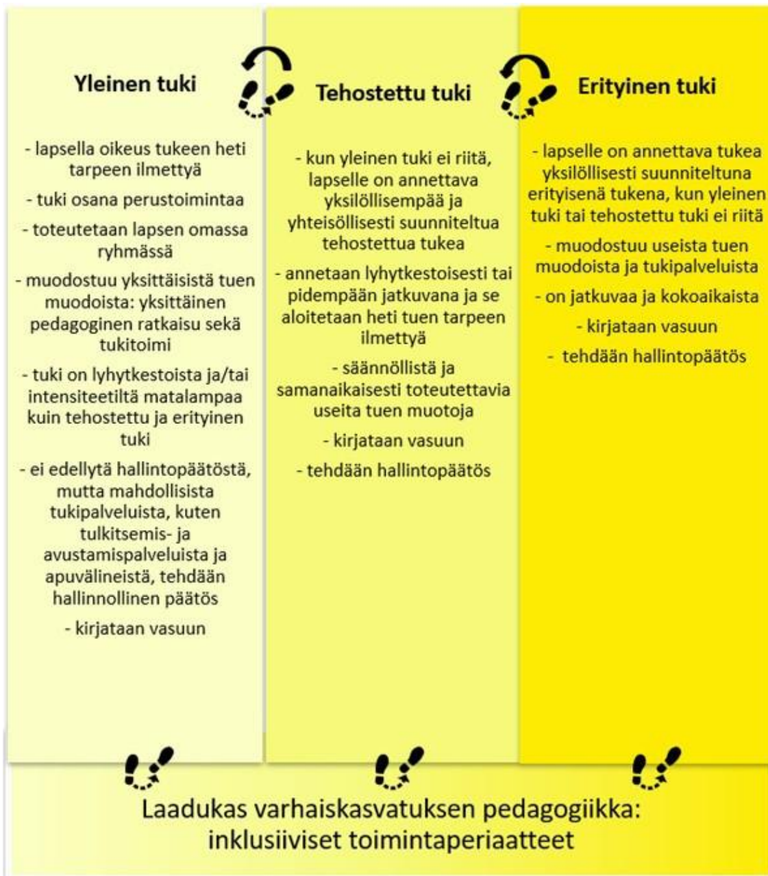
Tuen askeleet Pälkäneellä

Meillä Pälkäneellä laadukkaaseen pedagogiseen varhaiskasvatukseen kuuluvat lapsen vahvuusperustainen huomioiminen, kasvattajan sensitiivinen työtapo, selkeä struktuuri, esimerkiksi kuvitettu päiväjärjestys ja pienryhmätoiminta. Suunnittelemme pienryhmätoimintaa lasten mielenkiinnonkohteiden mukaan ja huomioimme tuen sekä pedagogisen näkökulman.